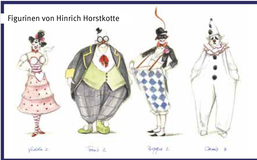
Figurinen von Hinrich Horstkotte

Premiere Plauen 10. Juni – 19.30 Uhr – Vogtlandtheater