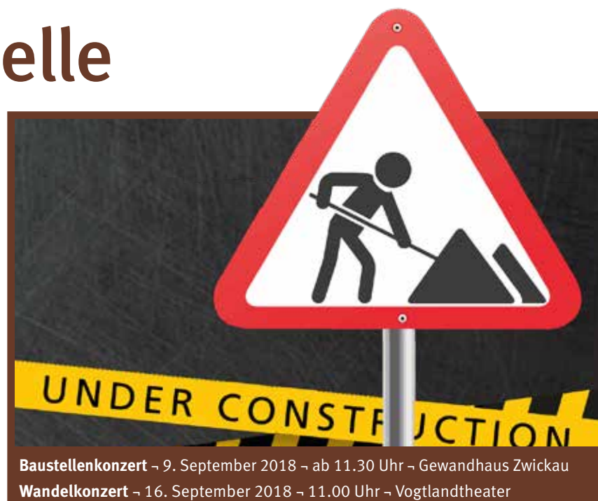
Baustellenkonzert – 9. September 2018 – ab 11.30 Uhr – Gewandhaus Zwickau

mit den Mitgliedern des Philharmonischen Orchesters Plauen-Zwickau mit Kammermusik zu erleben sein. In verschiedenen Räumlichkeiten spielen an diesem Tag unterschiedliche Ensembles Werke von Felix Mendelssohn Bartholdy, Benjamin Britten, Lars Eric Larsson und Johann Sebastian Bach. Lassen Sie sich unser Baustellenkonzert nicht entgehen! Alle Plauener dürfen sich auch auf diese Musik freuen, denn sie erklingt als Wandelkonzert am 16. September an verschiedenen Orten des Vogtlandtheaters.