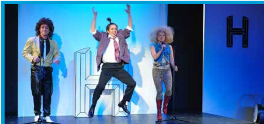
HORCH was kommt von draußen rein – Liederabend rund um das Automobil – ab 12 Jahren

ten und vor allem schnellsten Auto-Hit-Quiz der Welt. Die Ratesendung HORCH was kommt von draußen rein erleben Sie dann Jahrzehnt für Jahrzehnt in neuer, authentischer Optik und gehen somit auf eine spannende Zeitreise von den 1950er-Jahren bis ins Heute, bei der auch ein Blick in die Zukunft geworfen wird. Von Henry Valentinos Im Wagen vor mir über Ein himmelblauer Trabant von Sonja Schmidt bis hin zu Songs von den Toten Hosen und den Ärzten – hier ist (nicht nur) für jeden Autoliebhaber etwas dabei!