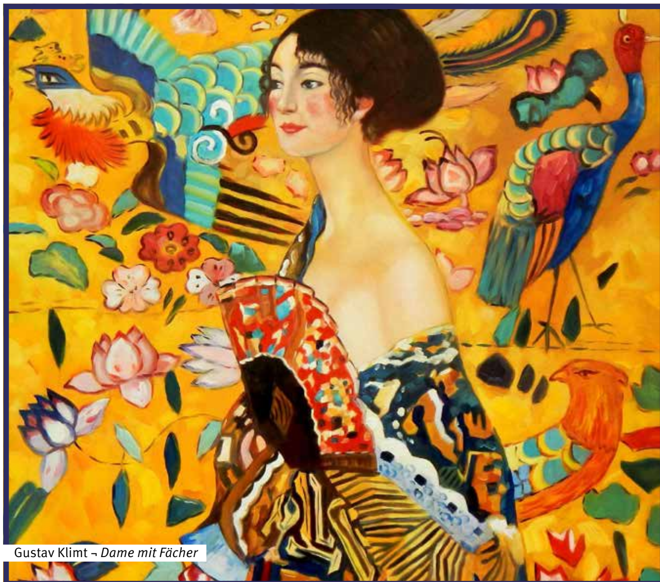
Gustav Klimt – Dame mit Fächer

Premiere Zwickau 19. Oktober 2018 – 19.30 Uhr – Aula der Pestalozzischule