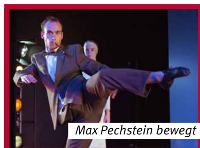
Max Pechstein bewegt